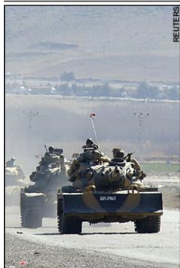
Turkish tanks move near the southeastern Turkish town of Silopi

By Megan Levy and agencies 10:49AM GMT 22 Feb 2008